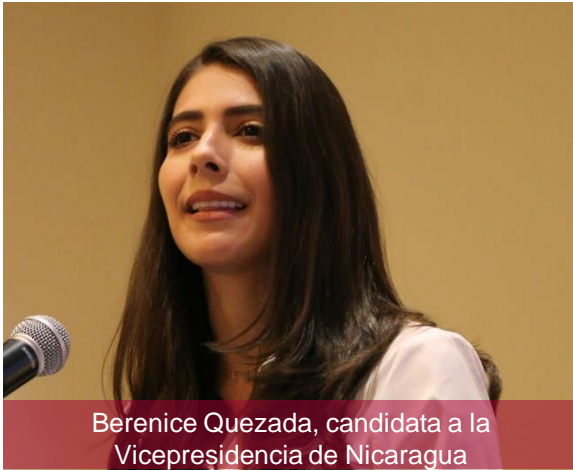
Berenice Quezada, candidata a la Vicepresidencia de Nicaragua