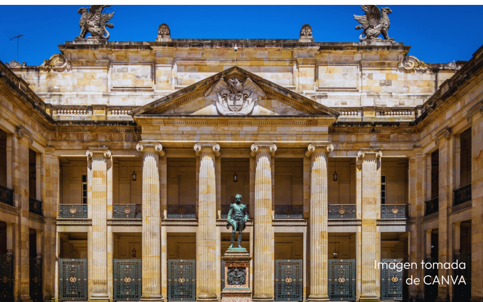
Imagen tomada de CANVA

Para acceder a más información o si deseas un seguimiento específico para tu sector, puedes visitarnos en www.kreab.com .