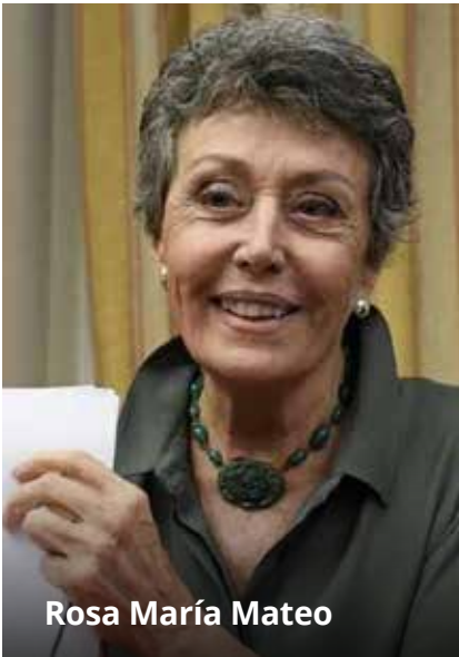
Rosa María Mateo

El cambio de gobierno supuso entradas y salidas de los medios de comunicación públicos. Es el caso de RTVE , en la que Rosa María Mateo sustituyó como presidenta de la corporación a José Antonio Sánchez .