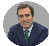
ANTONIO GARAMENDI | Presidente de la CEOE

“La propuesta económica ni siquiera corrige la inflación con la que va a cerrar este año y, en materia de condiciones laborales, hay muchas cuestiones que para nuestra organización deberían estar en el documento”.