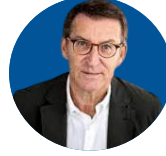
ALBERTO NUÑEZ FEIJÓO | Presidente del Partido Popular

"El PSOE ha mostrado una resistencia total a desbloquear la Ley de Vivienda".