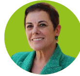
MERTXE AIZPURUA | Portavoz de EH Bildu en el Congreso de los Diputados

“(…) quiero decir claramente que nos han ocultado el aumento unilateral en el gasto en defensa y que es una vergüenza”.