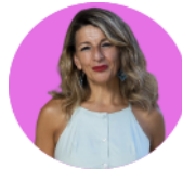
YOLANDA DÍAZ | Ministra de Trabajo y Economía Social

"La preparación de los PGE 2023 ha estado marcada, un año más, por 4 principios: prudencia, responsabilidad social, justicia social, y modernización y eficiencia económica".