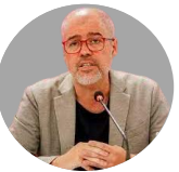
UNAI SORDO | Secretario General de Comisiones Obreras

“Son un buen borrador, pero estos Presupuestos no cuentan con la mayoría. Para eso tienen que ser negociados con el resto de grupos, que son los de la investidura, e intentaremos que la música que nos suena bien se concrete en una letra que sea adecuada”.