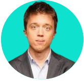
ÍÑIGO ERREJÓN | Portavoz de Más País en el Congreso de los Diputados

“Son un buen borrador, pero estos Presupuestos no cuentan con la mayoría. Para eso tienen que ser negociados con el resto de grupos, que son los de la investidura, e intentaremos que la música que nos suena bien se concrete en una letra que sea adecuada”.