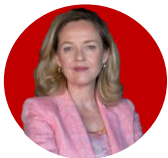
NADIA CALVIÑO | Ministra de Asuntos Económicos y Transformación Digital

"Aprobamos unos Presupuestos Generales del Estado para proteger a la clase media y trabajadora, avanzar en justicia social y garantizar la prosperidad económica de España".