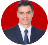
PEDRO SÁNCHEZ | Presidente del Gobierno

"Aprobamos unos Presupuestos Generales del Estado para proteger a la clase media y trabajadora, avanzar en justicia social y garantizar la prosperidad económica de España".