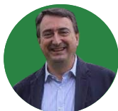
AITOR ESTEBAN | Portavoz del PNV en el Congreso de los Diputados

"Es una mala manera empezar a negociar algo que no conocemos".