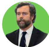
IVÁN ESPINOSA DE LOS MONTEROS | Portavoz de Vox en el Congreso de los Diputados

"Que el Gobierno no baje los impuestos a las clases medias y bajas es incompatible con hablar de presupuestos sociales (...). Estos Presupuestos, sin bajar impuestos, son unos Presupuestos antisociales desde el punto de vista de las rentas bajas y medias".