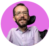
PABLO ECHENIQUE | Portavoz de Podemos en el Congreso de los Diputados

“Son presupuestos eminentemente sociales y expansivos, que cree que es lo que se necesita siempre y cuando vaya acompañado de una política fiscal ambiciosa que haga frente al enorme impacto del incremento de precios”.