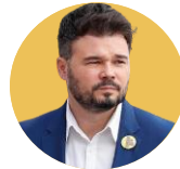
GABRIEL RUFÍAN | Portavoz de ERC en el Congreso de los Diputados

"Cada euro cuenta para pagar la factura de la luz".