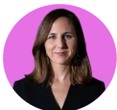
IONE BELARRA | Ministra de Derechos Sociales y Agenda 2030

"Son cuentas públicas que aportan certidumbres, que afrontan con valentía el efecto de la inflación y que consolidan la protección social y del tejido productivo que el Gobierno está impulsando".