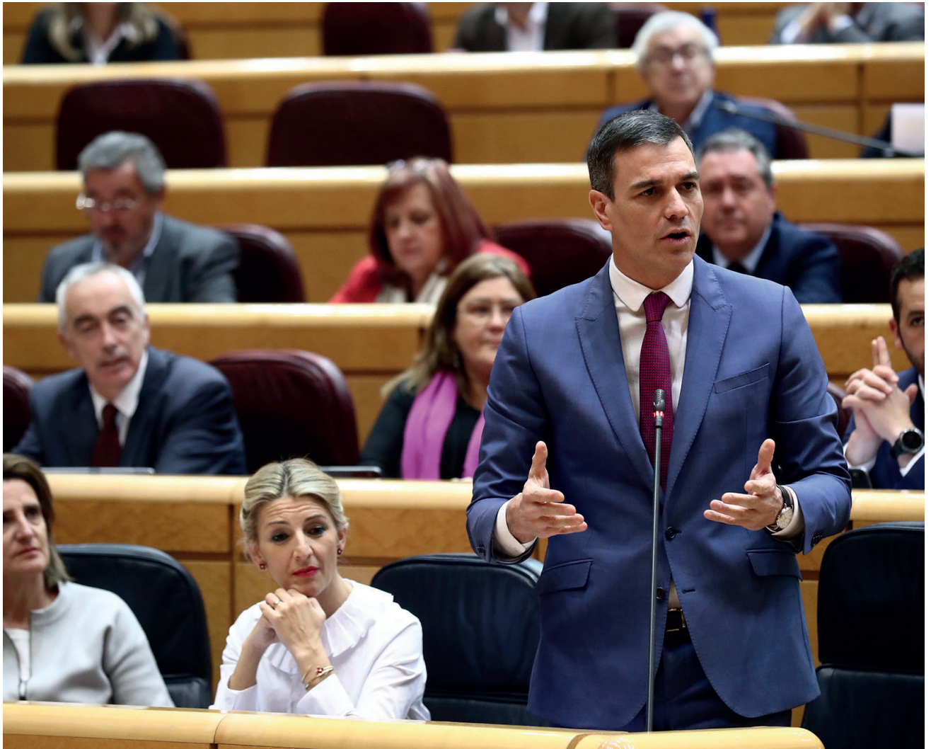
Pool Moncloa/Fernando Calvo. Senado, Madrid

Mientras la derecha se presenta articulada en torno a dos partidos (PP y VOX), la izquierda a la izquierda del PSOE se presenta atomizada en distintas marcas y coaliciones en todo el territorio, con una línea de fractura que, si antes se situaba entre PSOE y Unidas Podemos, ahora divide internamente este último espacio: Sumar, por una parte, y Podemos, por otra. La cita del próximo mayo puede ser decisiva en la configuración futura de ese espacio político, que será determinante de cara a las elecciones generales de finales de año.