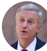
JOSÉ ANTONIO KAST | Fundador y excandidato presidencia del Partido Republicano

"No es la primera vez que la izquierda usa el aborto para polarizar, hoy lo hace un gobierno que habla de "dignidad", incapaz de vacunar a la población en riesgo, con severos problemas en SALUD. La UDI y quienes abrazamos la dignidad de la persona humana lo rechazamos."