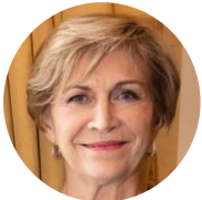
EVELYN MATTHEI | Alcaldesa de Providencia

"Más que Cuenta Pública, fue un cuento político a la barra del Presidente"