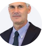
RODRIGO GALILEA | Presidente de RN

"Cuenta Pública 2024 del Pdte. Gabriel Boric, centrada en derechos: mujeres trabajadoras, cuidadoras y madres, derechos reproductivos. Salud: derechos de niños y niñas. Más seguridad y mejor economía. Nuevo financiamiento de educación superior. Desafíos importantes para el Congreso!"