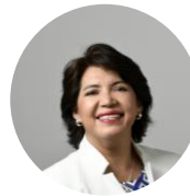
YASNA PROVOSTE | Senadora DC

"Los Republicanos siempre defenderemos la vida. Y no dejaremos que el gobierno cambie la agenda de las verdaderas urgencias sociales por una ideológica. Los chilenos necesitan más seguridad, más empleo y una mejor economía"