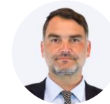
JAVIER MACAYA | Presidente de la Unión Demócrata Independiente

"Se ingresará una ley de aborto seguro que signifique un avance significativo en los derechos de las mujeres y decidir sobre la maternidad. Nuestro compromiso es avanzar y nunca retroceder. Bien Presidente Boric".