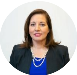
PAULINA VODANOVIC | Presidenta del Partido Socialista

"Una pena la falta de visión futura y lo pegado que está el Pdte. En temas que no son prioritarios y que solo le hablan a sus adherentes. Chile tiene otras urgencias y necesidades: seguridad, crecimiento económico, bajar listas de espera, recuperar el aprendizaje de los niños, más y mejores trabajos, etc".