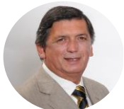
LAUTARO CARMONA | Presidente del Partido Comunista

A ratos pareció hablarle solo a su grupo de apoyo duro, creo que eso ensució el discurso, generó fisuras incluso dentro de su propia coalición gobernante y me pareció innecesario